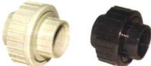
PP 15A~25A PVC