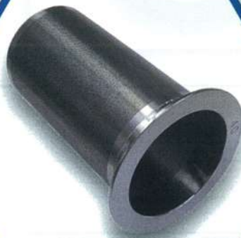
2.5S キャッチバスケット