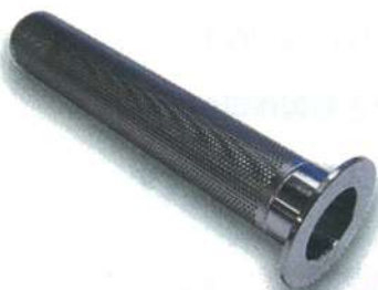
1S キャッチバスケット