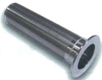
1.5S キャッチバスケット