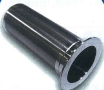
2S キャッチバスケット