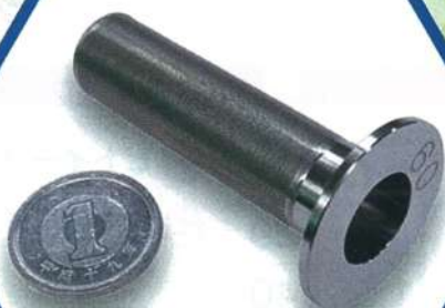
15A キャッチバスケット